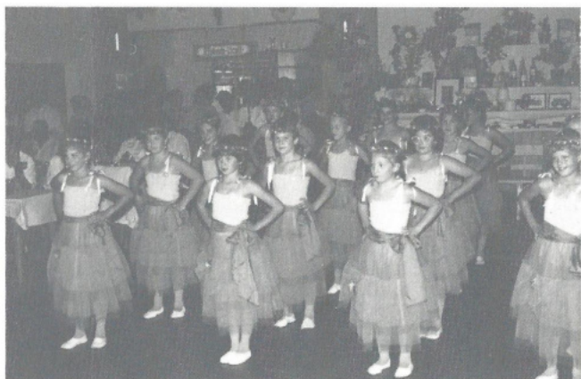
Tanz der Kinder beim Blumenball