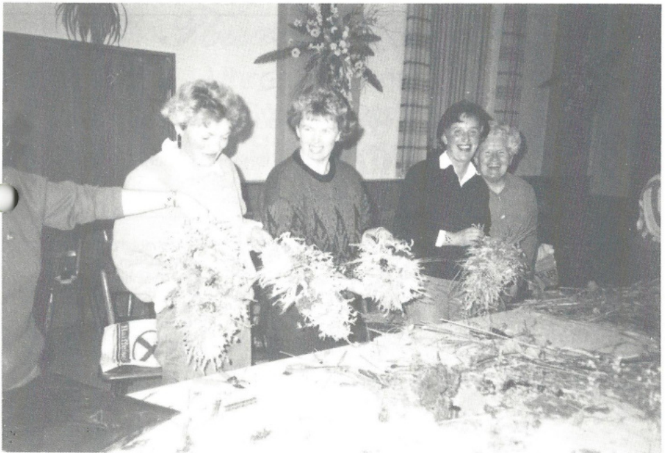
Bastelabend „Wandschmuck aus Trockenblumen“