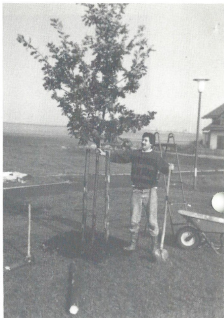
„Steht er gerade?“