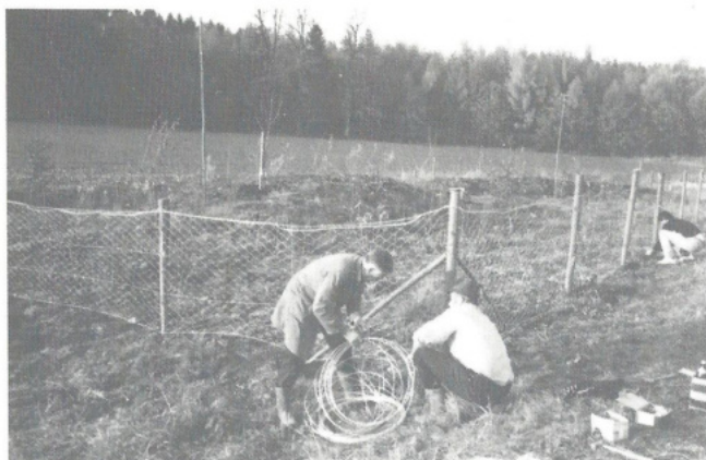
Trocken- und Feuchtbiotop Appertshofen