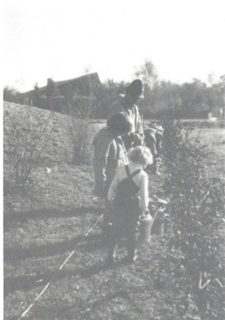
Pflanzaktion: Kinderspielplatz an der Raiffeisenstraße