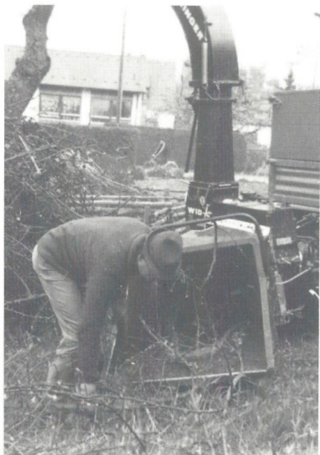
Vorführung eines Großhäckslers des Landkreises