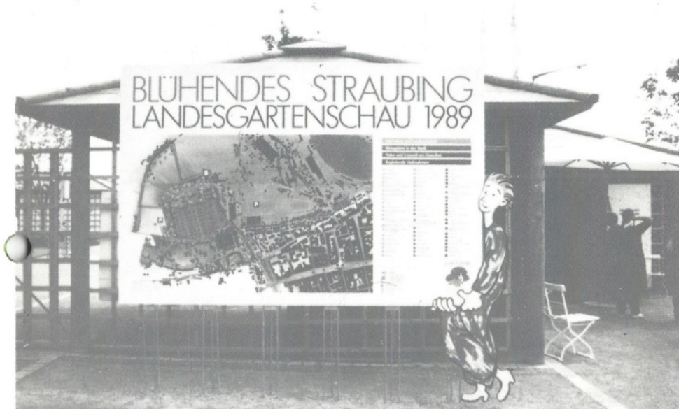
Vereinsausflug zur Landesgartenschau mit Stadtbesichtigung