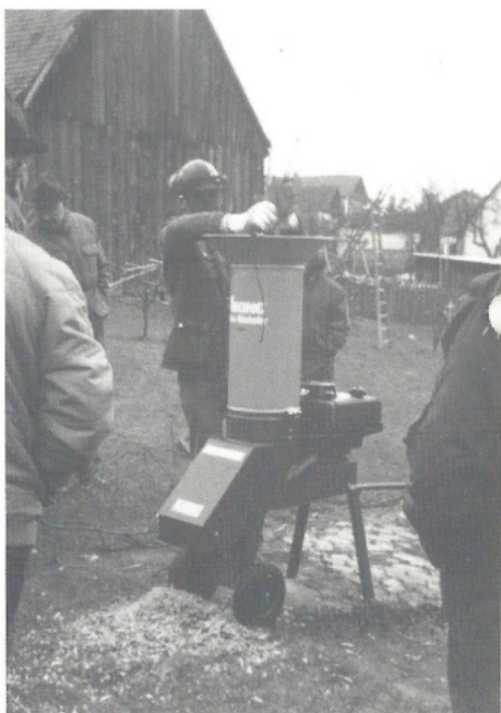
Der neue Häcksler im Dienst