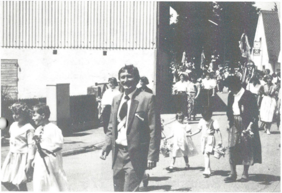
Umzug bei der Fahnenweihe des Ski- und Wanderclubs in Appertshofen