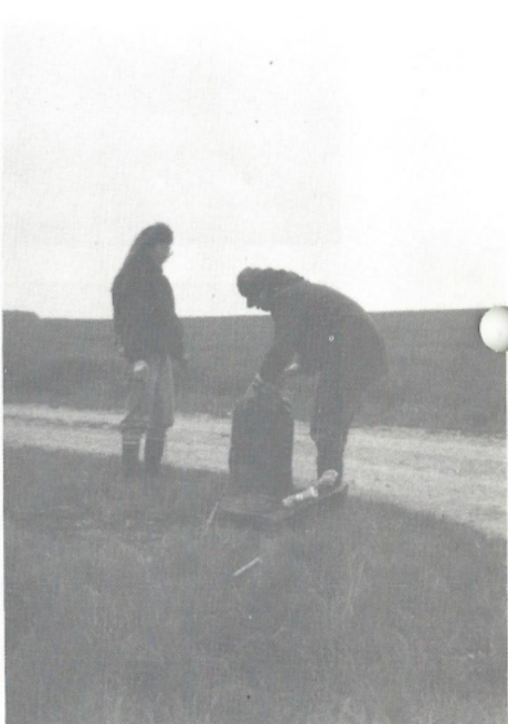
Aktion „Saubere Landschaft“