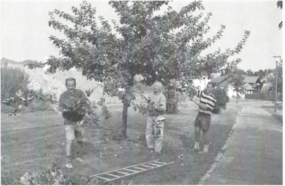
Sommerschnitt an Obstbäumen