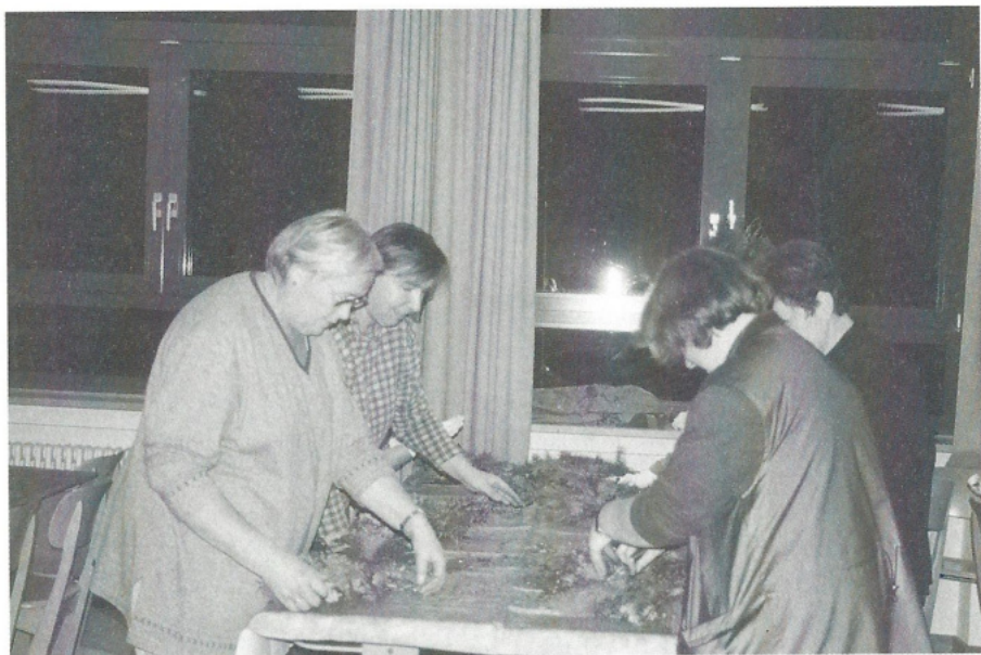
Ein weihnachtlicher Türkranz wird gefertigt.