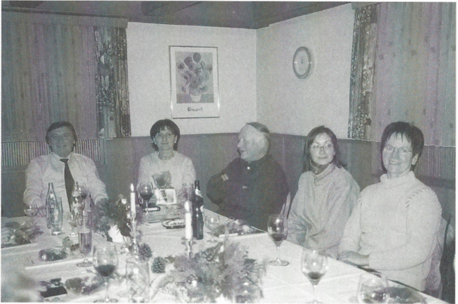
Abschlusssitzung mit kleiner Weihnachtsfeier der Vorstandschaft