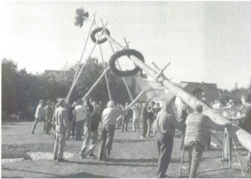
Auch der Gartenbauverein beteiligte sich beim Aufstellen des Kirtabaumes in Westerhofen.

450 Blumenzwiebeln und -knollen wurden an die 3 örtlichen Kindergärten übergeben. Der Kreisverband für Gartenbau und Landespflege Eichstätt hat die Kosten für die Frühjahrsblüher übernommen.