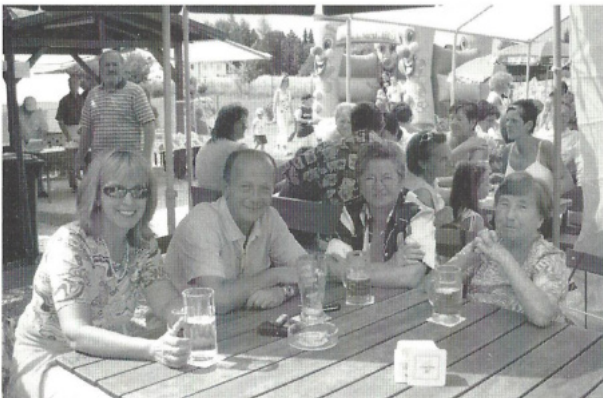
Gemütlichkeit bis in die späten Abendstunden.