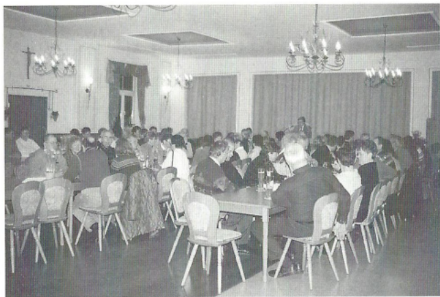
JHV am 5.3.2005 Fachvortrag "Rund um das Kleingewächshaus" durch den Gartenexperten Günter Holousch, Lenting.