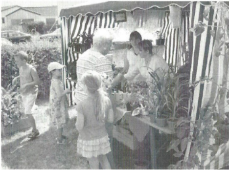
Die Blumentombola erfreute Jung und Alt.