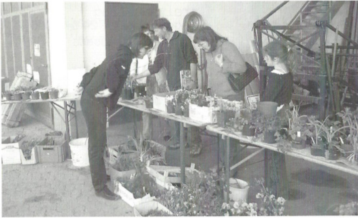
Pflanzenflohmarkt am 16.04.2005