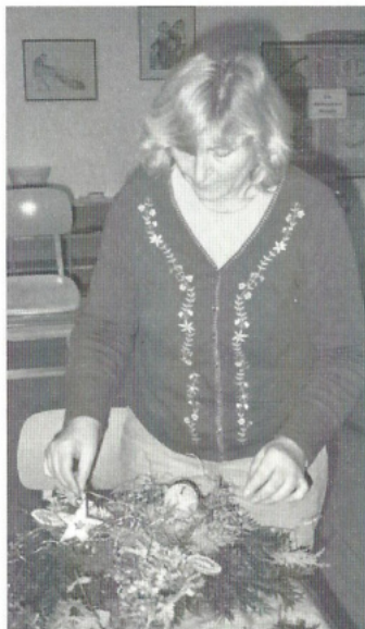
Bastelabend war angesagt: Fleißige und geschickte Hände fertigen ein Adventsgesteck.