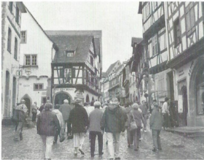
Eine Stadtführung in Freiburg rundete unser Programm ab, bevor wir die Heimreise über den Titisee antraten.