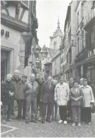
Der Ausflug ins Elsass führte uns nach Colmar, Riquewihir und Kayersberg.