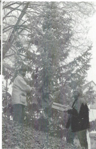
Christbaumaufstellen am 29.11.2007