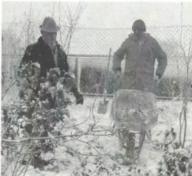
Men at work