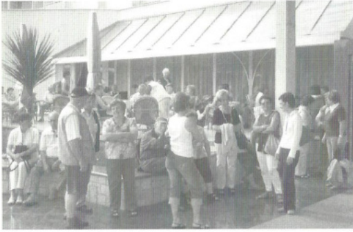
Das Hotel in Porec beherbergte uns für den Rest der Reise.