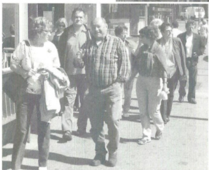
Besichtigung von Villach mit Zeit für eine Kaffeepause