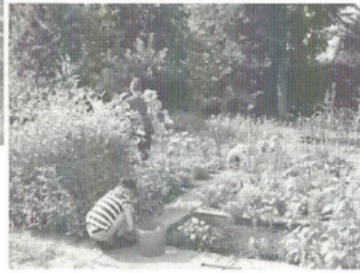
Die Beete des Gartens Ende Juli

Am Arbeitstisch erfuhren die Kinder allerhand rund um den Garten: Sie stellten Gierschlimonade her, benannten und kosteten frisch geerntetes Gemüse, bereiteten Kräuterbutter und Kräuterfrischkäse zu, gestalteten Fantasietiere aus Zitronenmelisseblättern, genossen Schokofondue mit selbst geernteten Früchten, pressten ihr Glas Apfelsaft selbst usw.