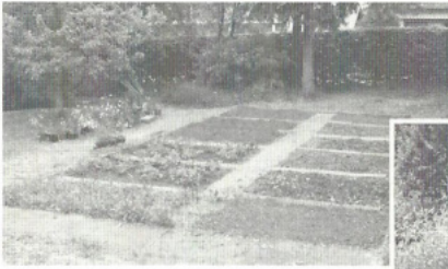
Der Schulgarten nach dem ersten „Arbeitstag“...