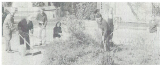
Pflegearbeiten am Friedhof in Stammham