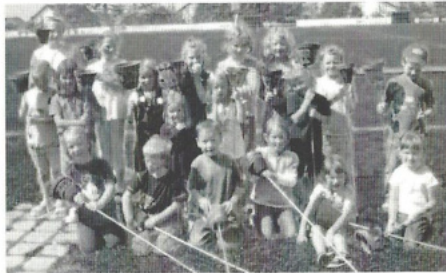
Tontöpfe auf Stab