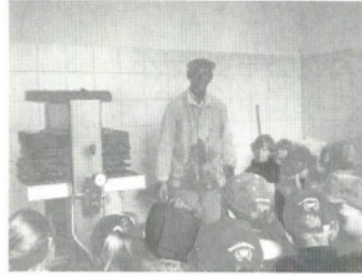
Besuch des Kindergartens beim Apfelpressen