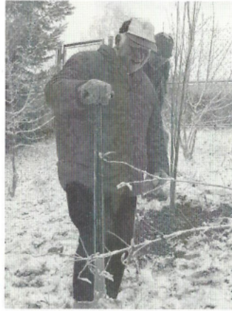
Pflanzaktion am 10.11.2007