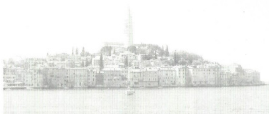
Fahrt entlang der istrischen Küste mit Blick auf Rovinj