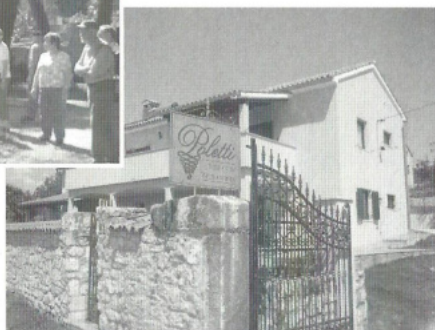
Der Tag klang mit einer fröhlichen Weinprobe auf diesem Weingut aus.