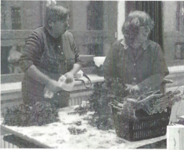
Adventskranzbinden am 20.11.2007