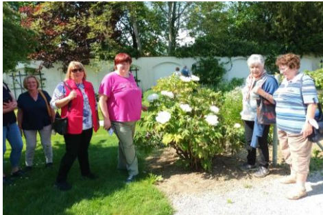
Stift Seitenstetten – im Garten.