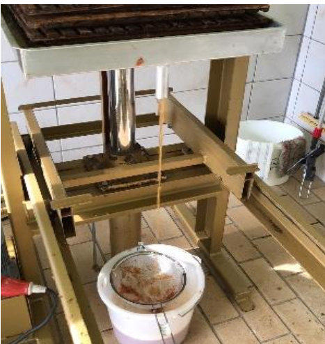
Der Saft läuft.