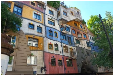
Hundertwasserhaus in Wien.