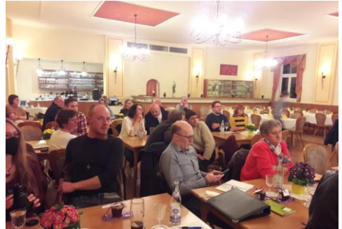
Blick in die Runde der Anwesenden.