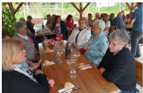
Weinprobe auf Weingut „Gritsch“