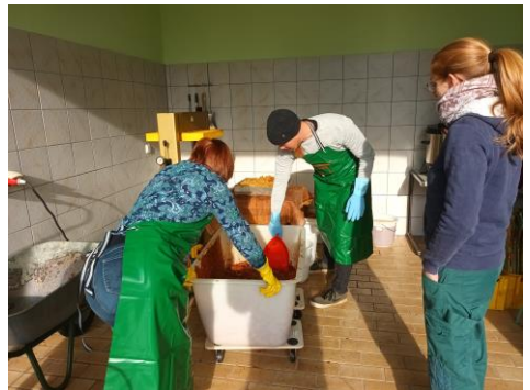
Ab zur Presse.