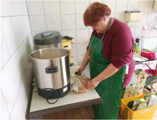
Sterilisieren und Abfüllen.