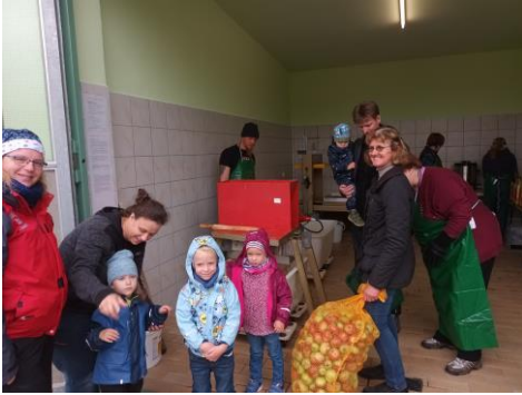
Anlieferung des Obstes.