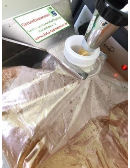
Abfüllen in 5 Liter Bags.