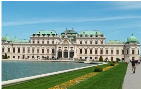
Schloß Belvedere in Wien.