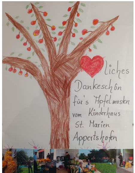
Besonders gefreut hat uns das Dankeschön des Kindergartens Appertshofen.