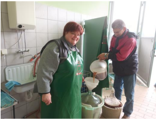
Es geht auch ohne Sterilisieren für Most.