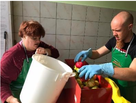
Schreddern der Äpfel, Birnen..

Bei uns werden Ihre Äpfel liebevoll behandelt.