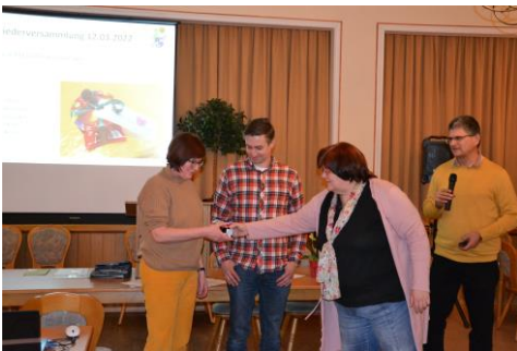
Ein herzliches Willkommen von 5 neuen Mitgliedern.