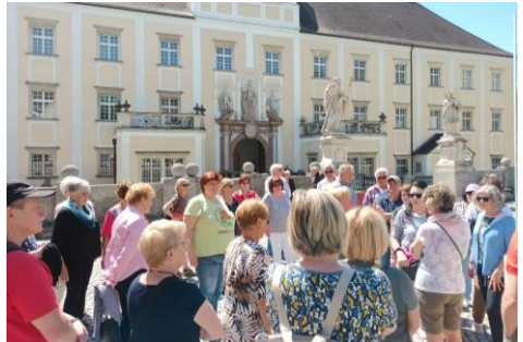
Stift Kremsmünster auf der Rückfahrt.